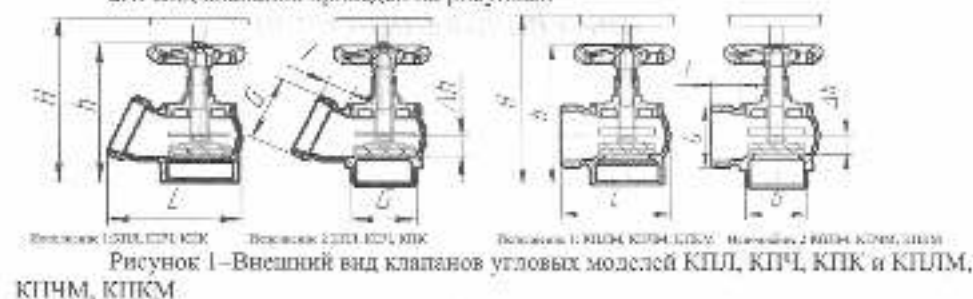
Рисунок 1 – Внешний вид клапанов угловых моделей К1П, К1ПЧ, К1ПК и К1ПМ, К1ПЧМ, К1ПКМ